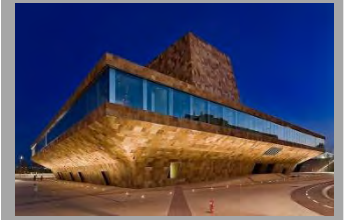
Teatre de la Llotja)