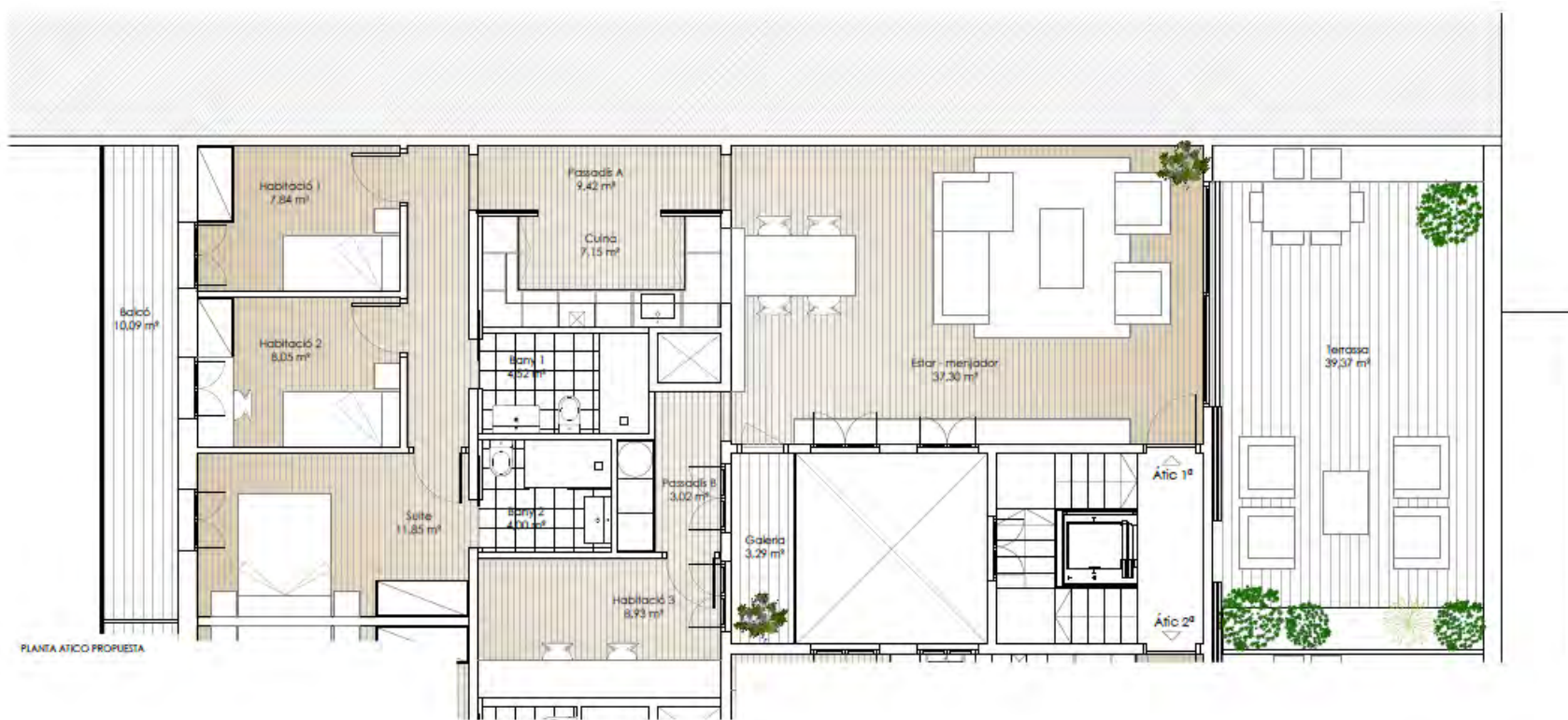
PLANTA ATICO PROPUESTA