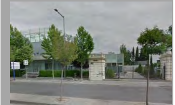
Hospital Santa Maria