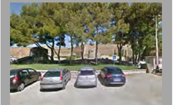
Parques y jardines (plaza hispanoamerica)